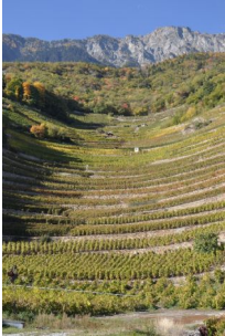
Combe d'Enfer, Fully.

Photos (haute définition sur demande par mail à museeduvin@netplus.ch ou à télécharger sur notre site internet www.museeduvin.ch )