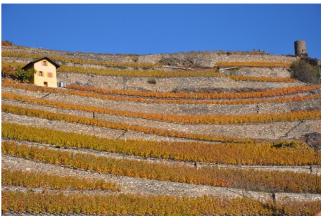
Terrasses de vignes, Sion.