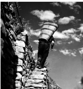
Escalier en pierres sèches, 1940-1950.