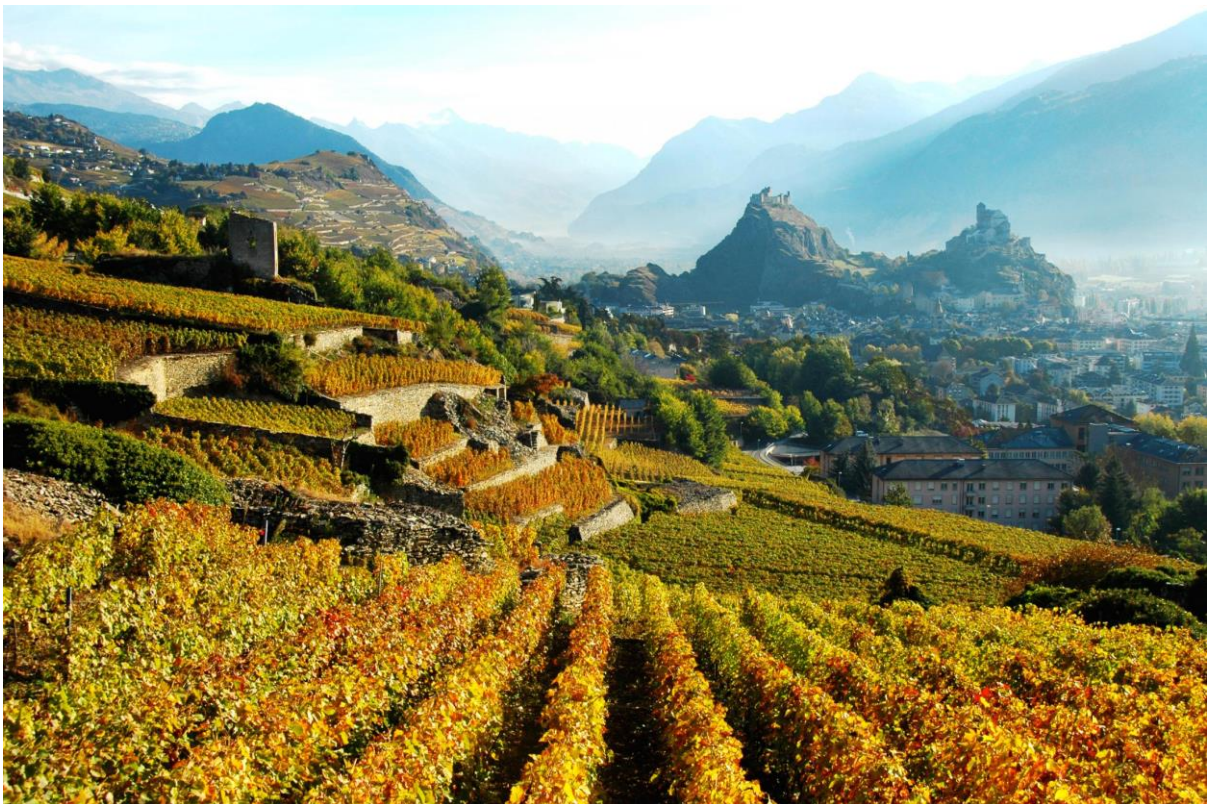
Vignoble de Sion